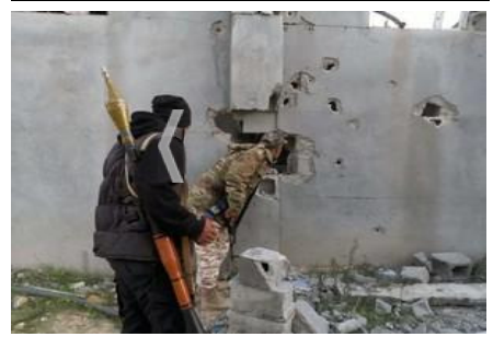
TRIPOLI, Nov. 18 (Xinhua) -- Fighters of the UN-backed government forces of Libya are seen in southern Tripoli, Libya, on Nov. 17, 2010. The forces of the UN-backed government